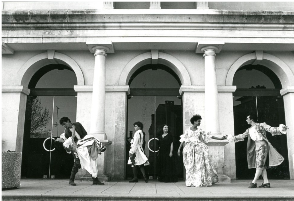
096 J 33 L'épreuve de Marivaux au Théâtre de Sainte-Tulle.