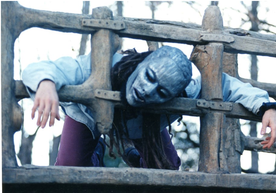
096 J 34 Histoire de silence

1 mise en scène : un cahier, vingt photos couleur. 2 manuscrits autographes des deux versions d'Alain Lorraine : copies.