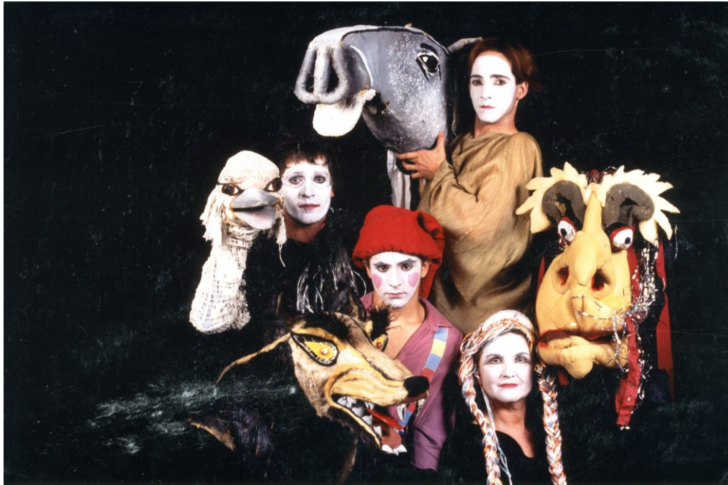
096 J 34 Contes à cloche pied

6 plaquette, note de présentation, tract, notes.