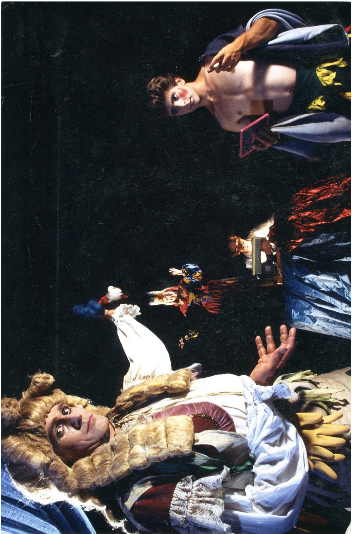
096 J 33 Festival Molière 1982