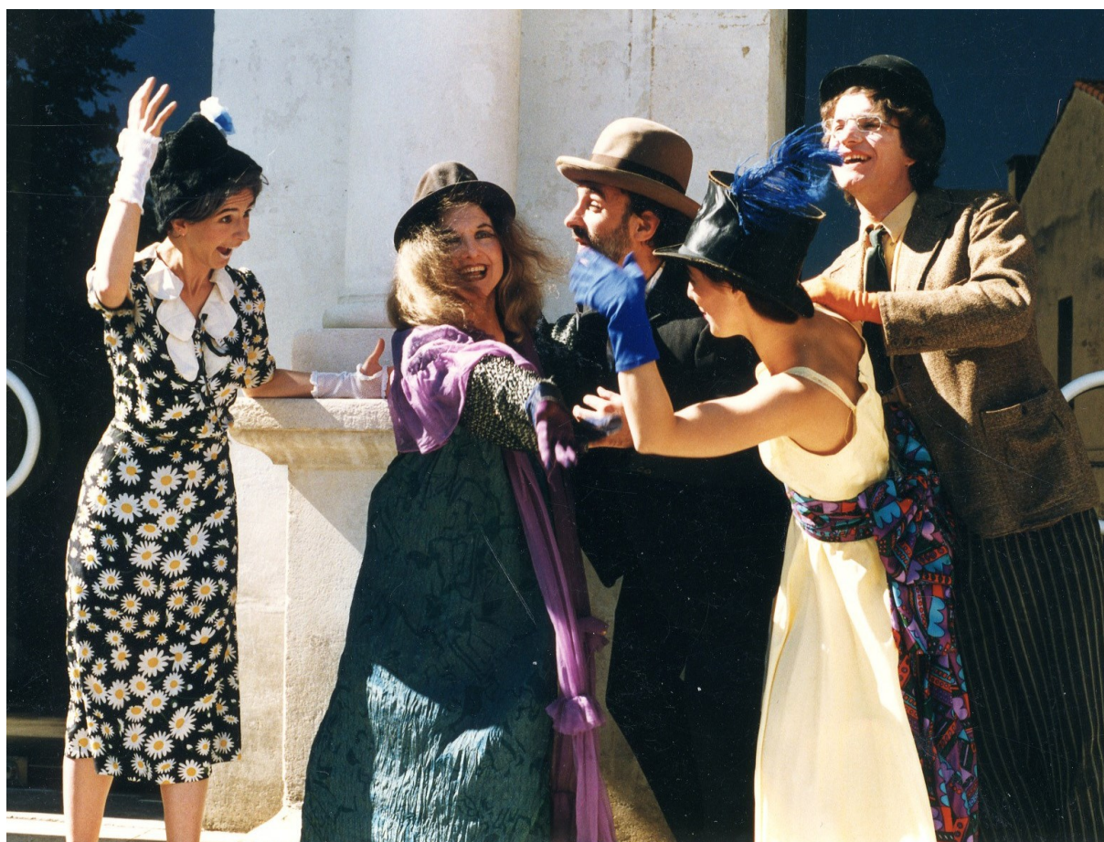
096 J 33 Comédies de Jean Tardieu