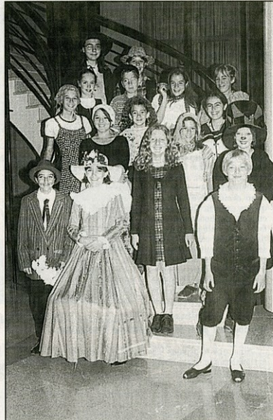
Les élèves du collège Gassendi qui ont participé à ce concours.

"Des élèves qui ont fait preuve d'originalité pour certains en revêtant des habits qui donnaient le ton au texte lu, avec une recherche très pointilleuse sur le maquillage, une touche originale sur la forme du chapeau. Des élèves très surs d'eux qui ont appris leur texte en l'interprétant sur les bases enseignées de l'oralité", conclura Sophie Laurence très heureuse du travail accompli par tous ces élèves des collèges et qui ont reçu une ovation du jury après lecture des résultats de ce concours d'élocution et de diction.