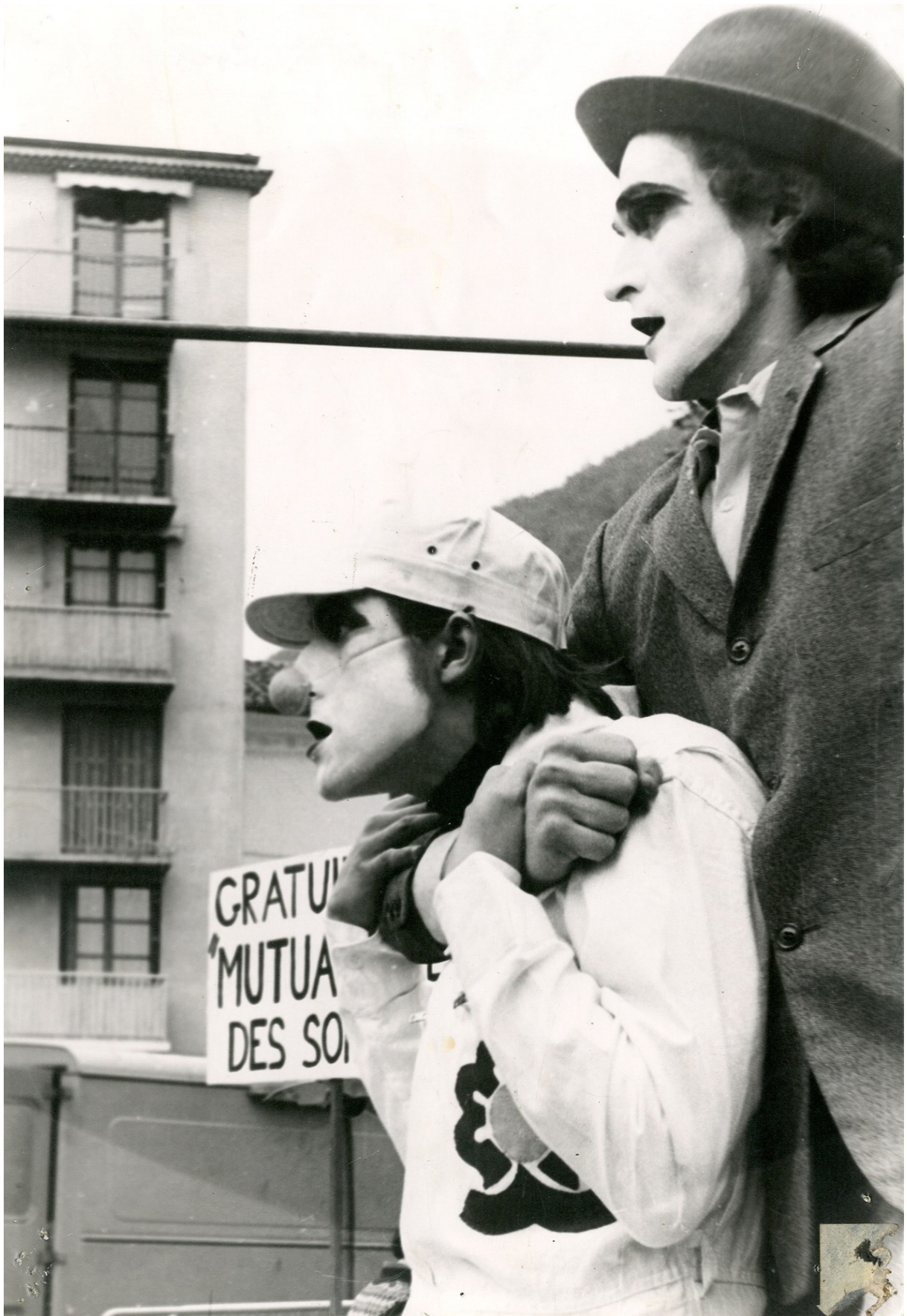
096 J 34 Morose vie de Rosie